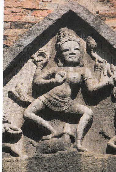
Zeița Yan Po Nagar de pe Turnurile Po Nagar Cham

Vietnamezii și-au apărât nordul cu succes, respingând invazia mongolă din 1279, în Cea De-a Doua Bătălie de pe Fluviul Bach Dang. Până în sec. XIV, partea centrală a Vietnamului de astăzi, până la trecătoarea Hai Van, era ocupată, orașul Hue